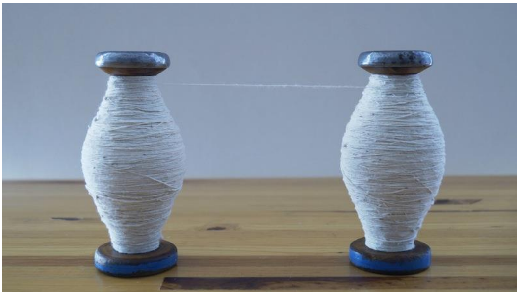
Fibras (Fibers) , 2014. Two wooden and metal reels and cotton thread. 15 x 6 x 100 cm.

Alongside this performance, we present work on paper, sculpture, photography and video, which also deal with the disappearance and invisibility of women, as well as femicide in Mexico. In the case of the series Names and Coordinates , a visual fabric is presented, made up of the names of all the women murdered in Ciudad Juárez (1985-2019) and in the State of Mexico (2016-2019), a work which is completed by another piece that shows the coordinates where the bodies of women who died violently from 2017 to 2019 have been found throughout the country.