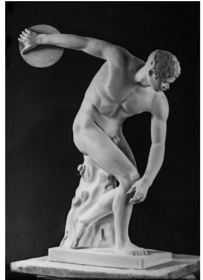
Discóbolo (black man) , 2018