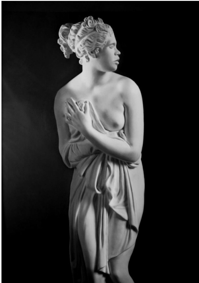
Venus de Cánova (black woman) , 2018