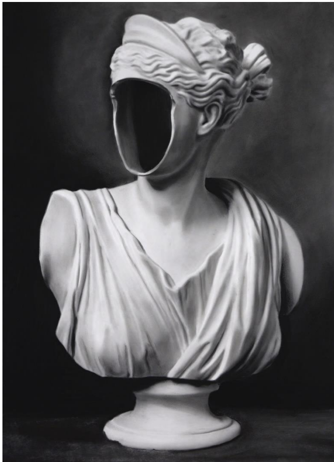
Mito Hueco 2 , 2018