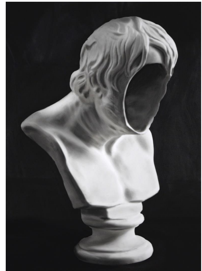
Mito Hueco 9 , 2018