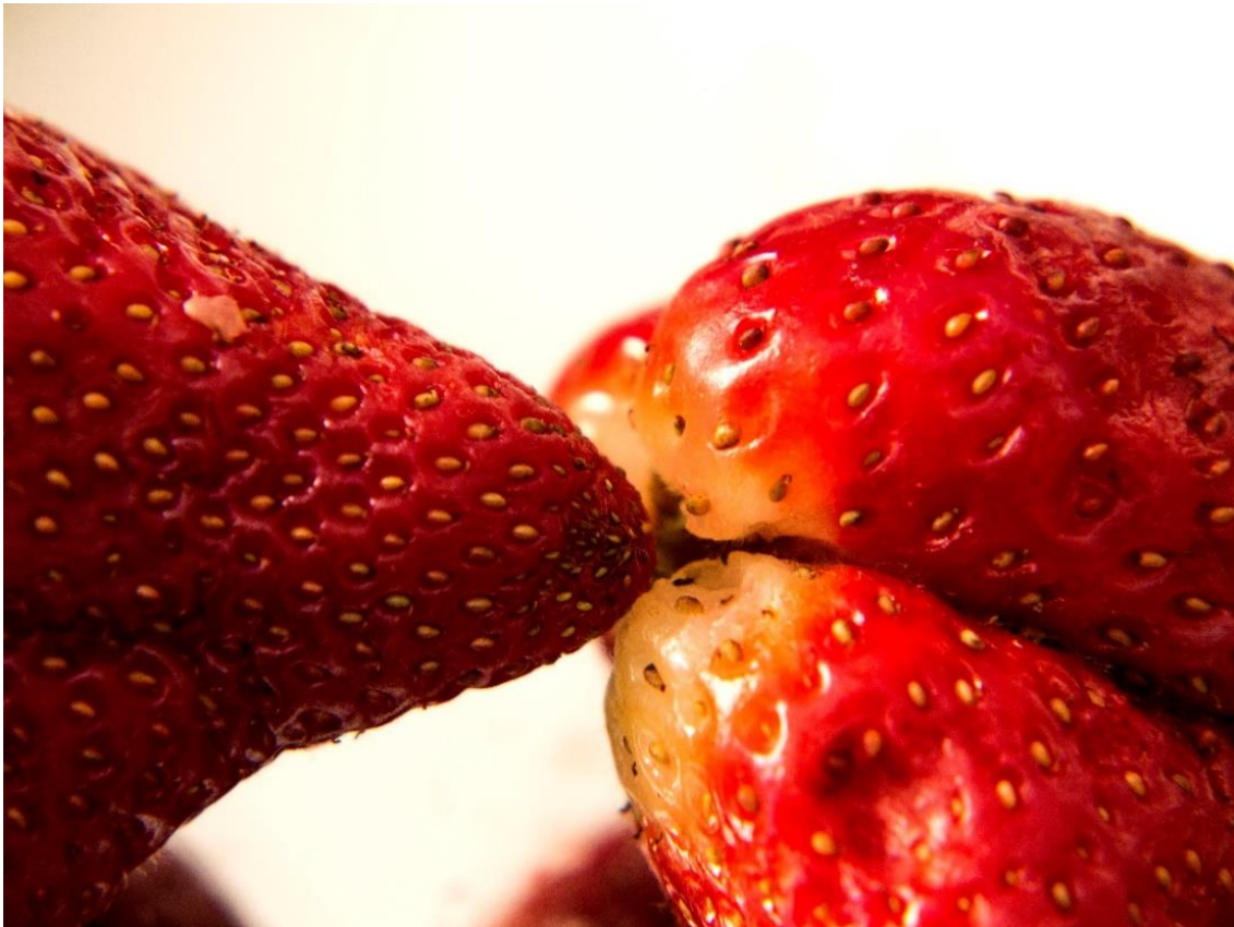
Series Transgénicos . 2018-2019. Digital photo