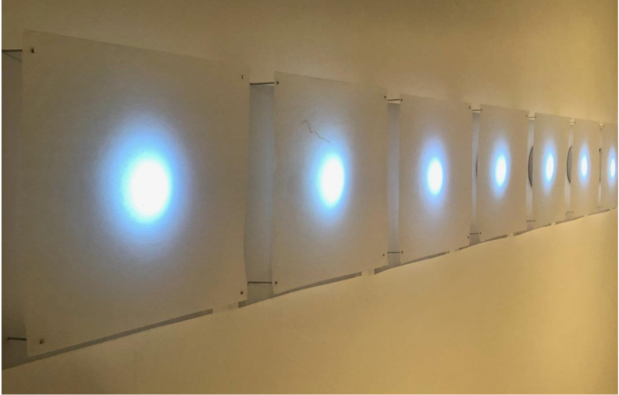
Datos fríos . 2019 (Fragmento de la instalación)

The exhibition Disipaciones presented in space LZ46 by the Mexican artist Gina Arizpe (1972) focuses in the research on the phenomenon of internal migration in Mexico, specifically the displacement of indigenous women that live in Mexico City.